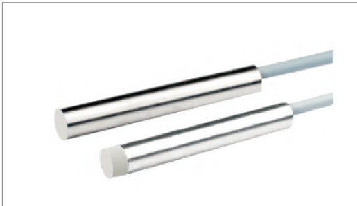
ID6.545系列电感式接近开关